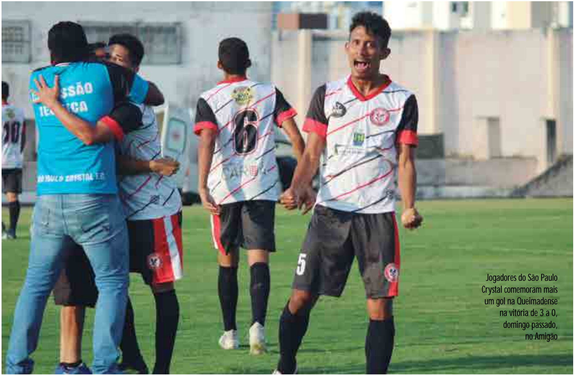
Jogadores do São Paulo Crystal comemoram mais um gol na Queimadense na vitória de 3 a 0, domingo passado, no Amigão

O domínio do Confiança foi total, mais não conseguiu transformar em gols, mesmo com todo incentivo da torcida que encheu as arquibancadas do Tadeuzão. No segundo tempo, a equipe de Lagoa Seca tentou uma reação e quase chegou ao gol de empate. O Sport-PB terá que vencer por um gol de diferença, no jogo de volta, para garantir o acesso à primeira divisão.