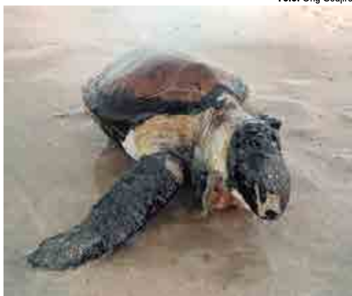
A tartaruga estava coberta de óleo, segundo informou a ONG Guajiru

Segundo o Ibama, até o momento, 16 pontos foram atingidos no Estado, em Rio Tinto, Conde, Pitimbu, João