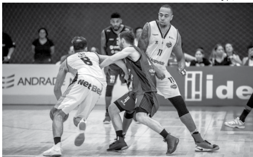
Torneio Integração serviu de preparação para a equipe paraibana que este ano vai disputar a divisão principal

No intervalo do jogo, as equipes receberam o troféu do Torneio Integração, que contou também com a participação do Minas Tênis Clube. A