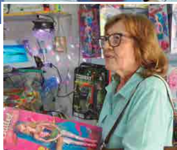
Muitos clientes decidiram comprar com antecedência para evitar tumulto

te até o dia 12 de outubro. A expectativa dela é positiva, principalmente com relação aos meses anteriores. "A gente espera aumentar as vendas em 40%, pelo menos; no ano passado, a média foi essa".