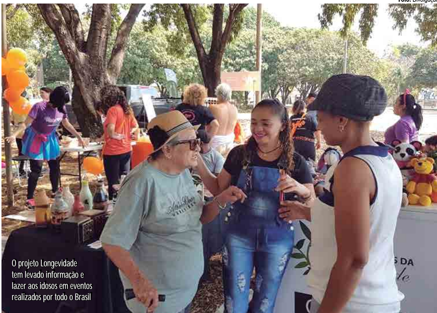
O projeto Longevidade tem levado informação e lazer aos idosos em eventos realizados por todo o Brasil

O "Encontros da Longevidade" contará também com um talk show comandado pela jornalista Liana Alagemovits, de Brasília. "Queremos propor o debate e desmistificar a questão do en-